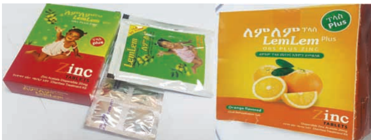
ምስል 10.2 ለምለም ፕላስ (በሎሚ እና በብርቱካን ጠዳም የተዘጋጀ)