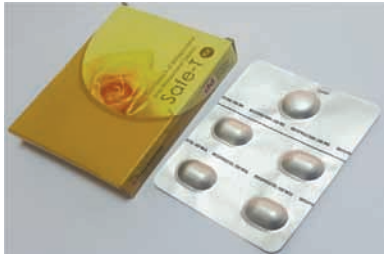
ምስል 9.1 ሴፍ-ቲ ኪት የፅንሰ ማቋረጫ እንክብል

ሴፍ-ቲ ኪት ለፅንሰ ማቋረጥ የሚጠቅም መድኃኒት ነው። እያንዳንዱ የሴፍ-ቲ ኪት እሽግ 1 ፍሬ ሜፊፕሪስቶን 200ሚ.ግ እና 4 ፍሬ ሚሶፕሮስቶል 200ማይክሮግራም ይዟል። ሴፍ-ቲ ኪት መስጠት ያለበት በጤና ተቋም ውስጥ በሰለጠነ የጤና ባለሙያ ብቻ ነው።