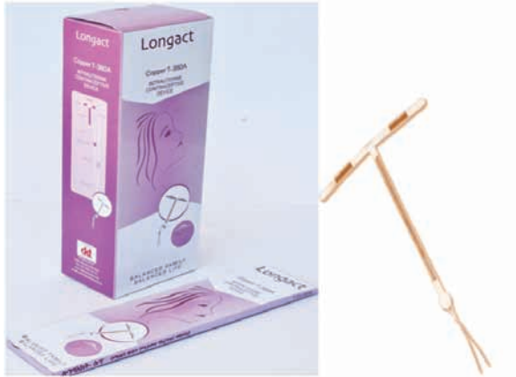
ምስል 7.1 ሎንግአክት (ኮፐር-ቲ 380ኤ) በማህፀን ውስጥ የሚቀመጥ የእርግዝና መከላከያ