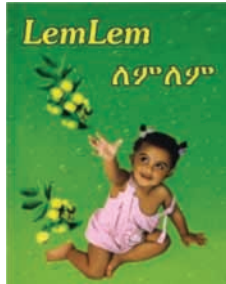
ምስል 10.1 ለምለም ህይወት አድን ንጥረነገር (የሎሚ ጠዓም ያለው)

እያንዳንዱ የለምለም እሽግ በውስጡ ሶስት ከረጢት ለምለም ህይወት አድን ንጥረነገር (ኢ.አር.ኤስ) ይዟል።