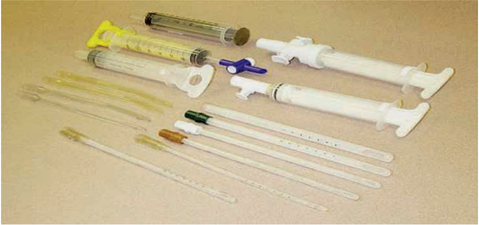
ምስል 9.2 ለፅንሰ ማቋረጥ የሚጠቅም በእጅ የሚሠራ መምጠጫ መሣሪያ