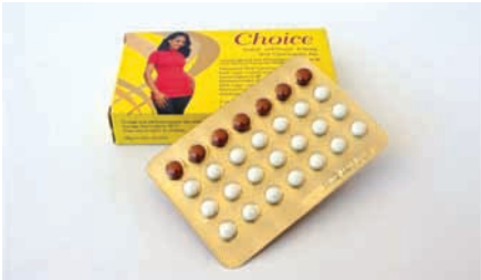
ምሳሌ: 4.1 ችይስ በአፍ የሚወሰድ የእርግዝና መከላከያ እንክብል

በችይስ እሽግ ውስጥ የሚገኙት ከአካላዊ ቅመም ጋር ተመሳሳይነት ካላቸው ንጥረ ነገሮች የተፈበረኩ የእርግዝና መከላከያ እንክብሎች ሁሉም ባለአኩል መጠን የኤስትሮጅን እና ፕሮጀስቲቭን ይዘት አሏቸው። እያንዳንዱ የችይስ እሽግ ባለ 28 ፍሬ ሲሆን፤ ይዘታቸው ሌቮኖርጀስትሪል 0.15 ሚ.ግ + ኢትናይልአስትራዲዮል 0.03 ሚ.ግ የሆነ 21 ነጭ የእርግዝና መከላከያ እንክብሎች እና ይዘታቸው ፊሪስ ፋሚልት 75 ሚ.ግ የሆነ 7 ቡኒ የአይረን እንክብሎችን ይይዛል።