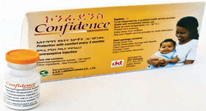
ምስል 5.1 ኮንፌደንስ ዲፖደስቲን በመርፌ መልክ የሚሰጥ የእርግዝና መከላከያ

ኮንፌደንስ ጡት የሚያጠቡ እናቶችም ሊጠቀሙት የሚችሉ የእርግዝና መከላከያ ነው። ሆኖም ግን መሰጠት መጀመር ያለበት ከወለደች ስድስት ሳምንት እና ከዚያ በላይ ለሆናት የምታጠባ እናት ነው።