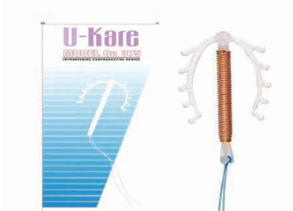
ምስል 7.2 ዩ-ኬር (ኮፐር 375) በማህፀን ውስጥ የሚቀመጥ የእርግዝና መከላከያ