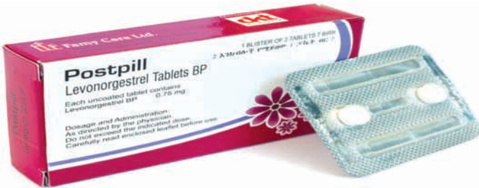
ምስል 4.4 ፖስት-ፒል (የድንገተኛ እርግዝና መከላከያ እንክብል)

ፖስት-ፒል ባለጠላ አካላዊ ቅመም የያዘ ሲሆን የተሰራውም በሴቶች አካል ውስጥ በተፈጥሮ ከሚመረተው ፕሮጀስቲቮን አካላዊ ቅመም (ሆርሞን) ጋር ከሚመሳሰል ፕሮጀስቲቮን ከሚባል ንጥረነገር ነው። እያንዳንዱ የፖስት-ፒል እሽግ በውስጡ ሁለት ባለ 0.75 ሚ.ግ ሌቮኖርጂስትሪል እንክብሎች ይዟል።