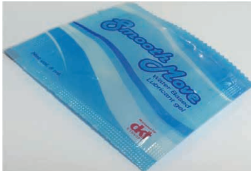
ምስል 3.1 ስሙዝ ሙብ ማለስለሻ ቅባት

ስሙዝ ሙብ ለስላሳ፣ ዘይትነት የሌለው፣ የማያጣብቅ፣ ሽታ እና ቀለም አልባ ዝልግልግ ማለስለሻ ቅባት ነው። እያንዳንዱ ስሙዝ ሙብ በውስጡ 5 ሚሊ ሊትር ማለስለሻ ቅባት ይዟል።