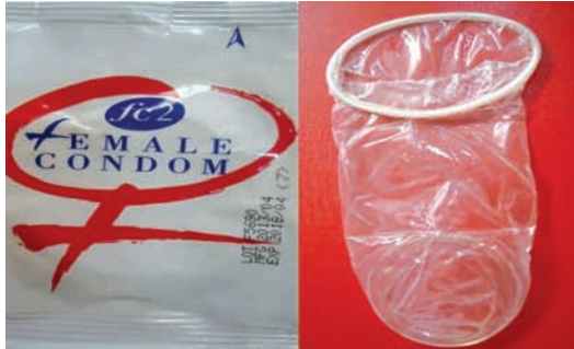
ምስል 2.1 የሴት ኮንዶም

ሴቶች በግብረሰጋ ግንኙነት ጊዜ በብልታቸው ውስጥ በማጥለቅ የሚጠቀሙበት የእርግዝና መከላከያ ዘዴ ነው። የተሰራውም በጣም ስለ ከሆነ ቅባት ያለው ፕላስቲክ ሲሆን በሁለቱም ጫፍ ቀለበቶች አሉት።