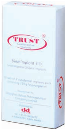
ምስል 6.1 ትረስት ኢምፕላንት II - በክንድ ቆዳ ስር የሚቀበር የእርግዝና መከላከያ

ትረስት በሴቷ ክንድ ቆዳ ስር የሚቀበረው እና አገልግሎቱ ሲያበቃ ወይም በሴቷ ፍላጎት መሠረት የሚወጣው በሰለጠነ የጤና ባለሙያ ብቻ ነው።