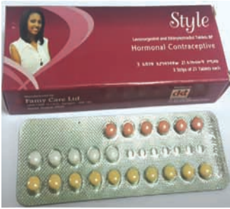
ምስል 4.2 ስታይል በአፍ የሚወሰድ የእርግዝና መከላከያ እንክብል

ስታይል እርግዝናን ለመከላከል እና የወር አበባ ጊዜውን ጠብቆ እንዲመጣ ለማድረግ ይጠቅማል።