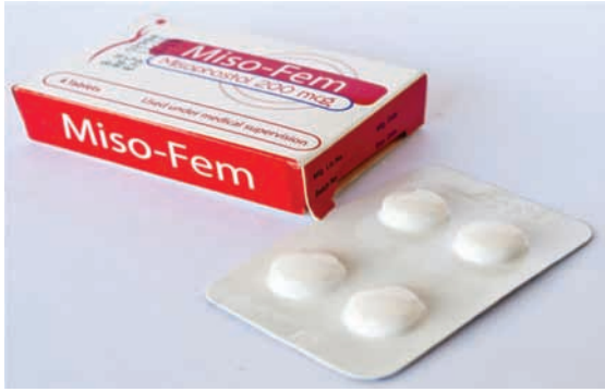
ምስል. 8.1 ሚሶ-ፌም በወሊድ ጊዜ የሚከሰት የደም መፍሰስ መከላከያ እና ማከሚያ እንክብል

ሚሶ-ፌም በወሊድ ጊዜ ሊከሰት የሚችል እናቶችን ለሞት የሚዳርግ ከፍተኛ የደም መፍሰስን ለመከላከል እና ለማከም ይጠቅማል።