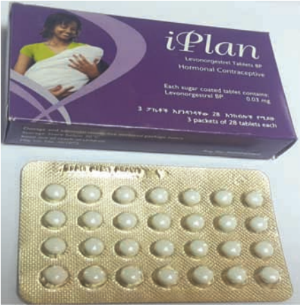
ምስል 4.3 አይፕላን በአፍ የሚወሰድ የእርግዝና መከላከያ እንክብል